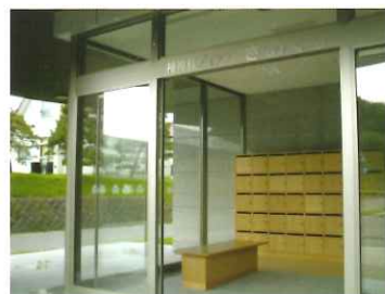
デイ・ナイトケア専用入口

グループ活動や趣味活動等を通じ個々に社会性の向上を図り、安定した社会生活をお送りいただけるようサポートいたします。