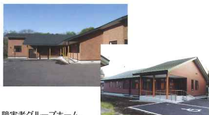
障害者グループホーム アザリア・あじさい

〒059-0463 登別市中登別町141番地5 【アザリア】 ☎(0143)83-0311 FAX(0143)83-0311 【あじさい】 ☎(0143)83-2030 FAX(0143)83-2030