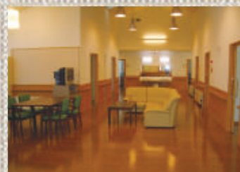
天井が高く開放感あふれる 共有スペース