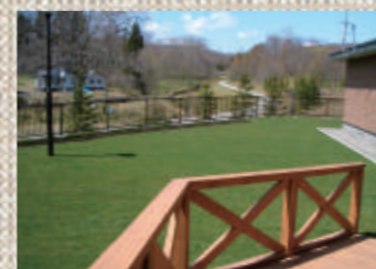
緑樹あふれる見晴らしのウッドデッキ