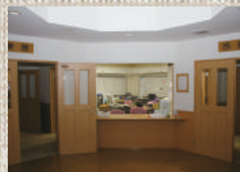
吹き抜けの塔から光が注ぐ 玄関ホール