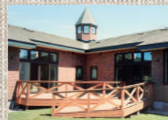
緑樹あふれる見晴らしのウッドデッキ