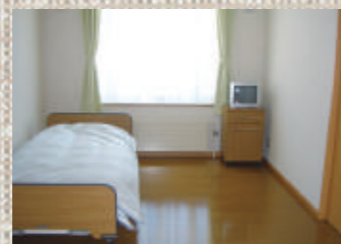
明るく、ゆとりのある居室