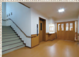
玄関・エレベーターホール